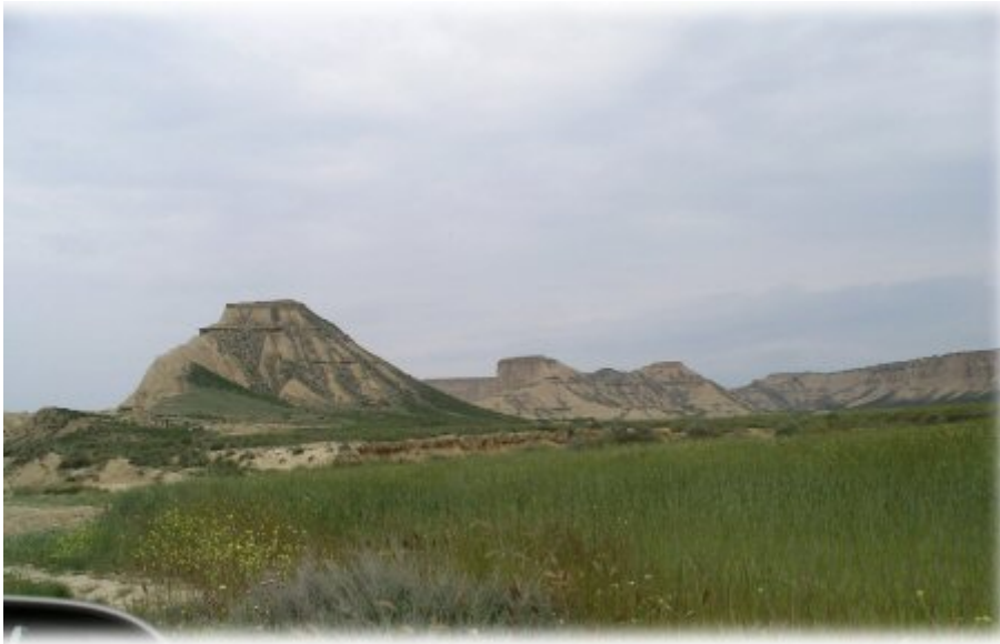
Les reliefs du secteur d'El Rallon et d'el Rincon de las Rallas

Nous déjeunons au pied d'un autre "monument" des Bardenas : El Rallon