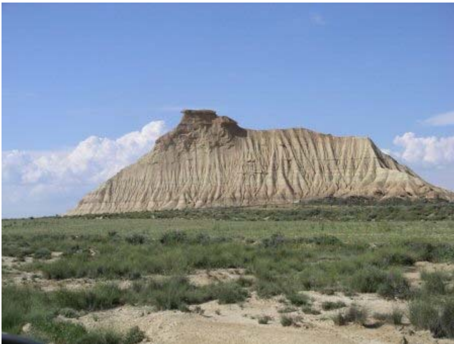
Relief très typique des Bardenas

Un carrefour en T marque la limite du polygone de tir. Nous contournons le polygone par le nord pour arriver dans la zone de las Cortinas où se trouve "LA" cheminée de fée, symbole des Bardenas. Cette cheminée s'appelle EI CASTIL DE TIERRA. Comme tous les reliefs de la région et contrairement à ce que semble montrer les nombreuses illustrations que l'on trouve ici et là, ce n'est pas gigantesque mais c'est une sculpture minérale assez exceptionnelle.