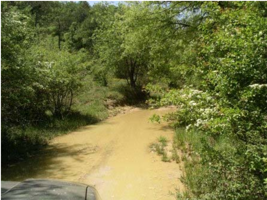
Encore un passage mouillé

Pour Julien, le conducteur du jour, une grande variété de situations qui d'après lui rend ce parcours très attractif.