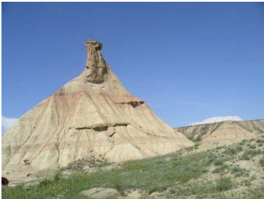
Incontournable et symbole des Bardenas : el Castil de Tierra

Nous continuons ensuite notre visite par les pistes qui mènent au secteur dit Aguilares et à l'entrée du champ de tir .De là, en longeant encore quelques collines qui émergent de la plaine, nous revenons vers le Castil de Tierra. En moins de deux heures, photos comprises, nous avons parcouru le secteur de la Bardenas Blanca.