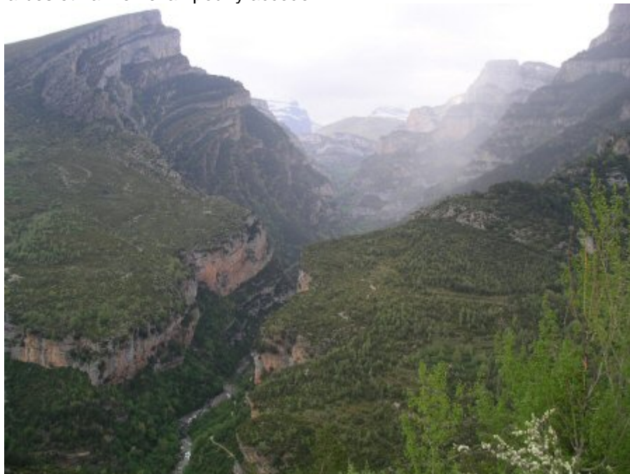
Gorges du Rio vellos, vue sur le Garganta de Anisclo

Le tunnel de Bielsa se situe à 22km à vol d'oiseau de LUZ st Sauveur mais il faut faire un détour de 150 km par Tarbes et Lannemezan pour y accéder.