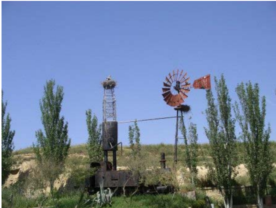
..... ont élu domicile sur tous les points hauts.

En particuliers, l'église San Salvador ne comporte pas moins d'une dizaine de nids. On pourrait même parler de surpopulation car il n'y a pas un point haut qui ne porte le sien.