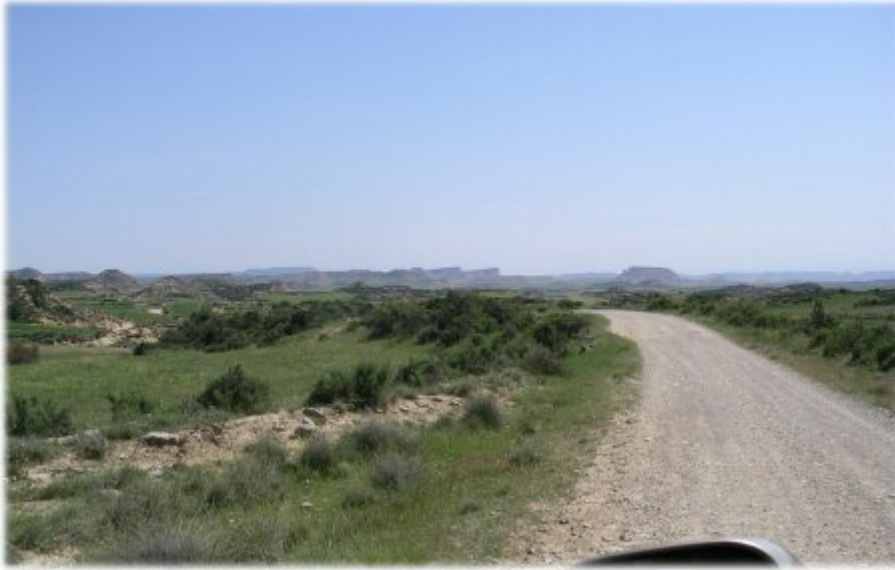
La piste d'entrée dans "le désert des BARDENAS" avec les premiers reliefs caractéristiques

...que nous atteignons en fin d'après midi. Pas besoin de cartes, de GPS ni de Road-book, les pistes sont bien tracées, bien balisées et il est interdit de s'en écarter !