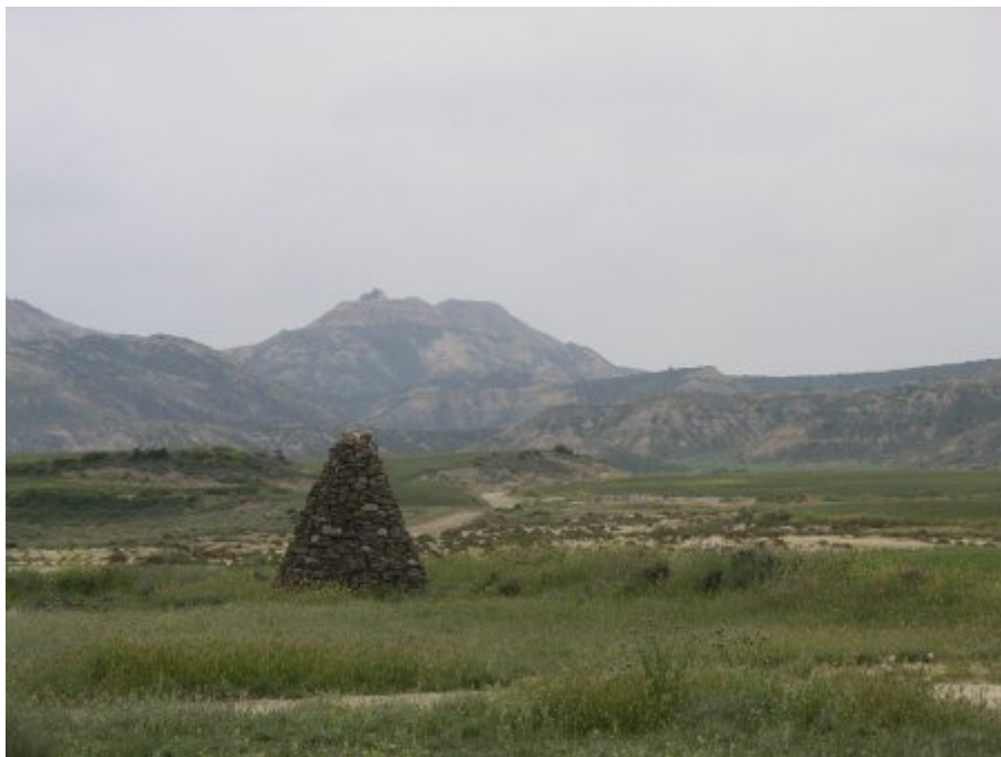
Bardenas Negra : un cairn gigantesque pour une piste interdite !

La route très sinueuse et en mauvais état serpente entre les collines. C'est une ancienne voie de transhumance. Sur les 25-30 km de la traversée, il n'y a qu'une seule piste qui part vers le sud et l'ermitage de Sancho Abarca puis au delà vers Tauste. Nous ne la prendrons pas, réalisant subitement que l'après-midi est bien avancé et que la route du retour est longue.