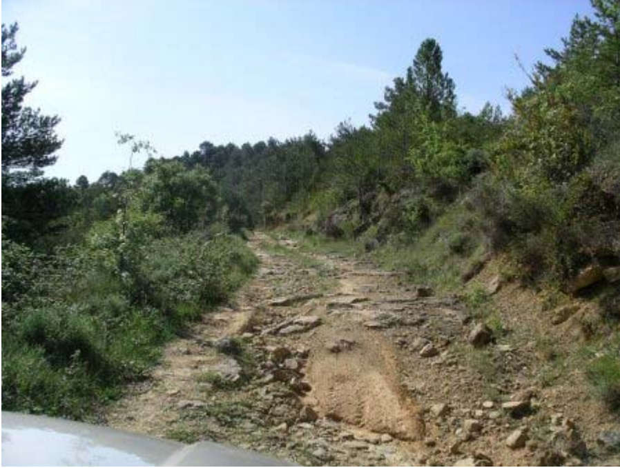
Sierra de Luna : piste vers les Bardenas

Mais étant seuls nous la parcourons un peu plus vite (c'est à dire que les arrêts photos sont plus courts).