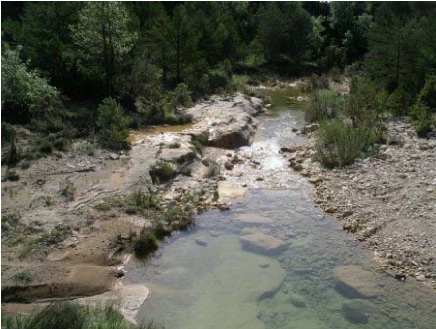
Forêts et torrents enchantent notre parcours.

Mais étant seuls nous la parcourons un peu plus vite (c'est à dire que les arrêts photos sont plus courts).