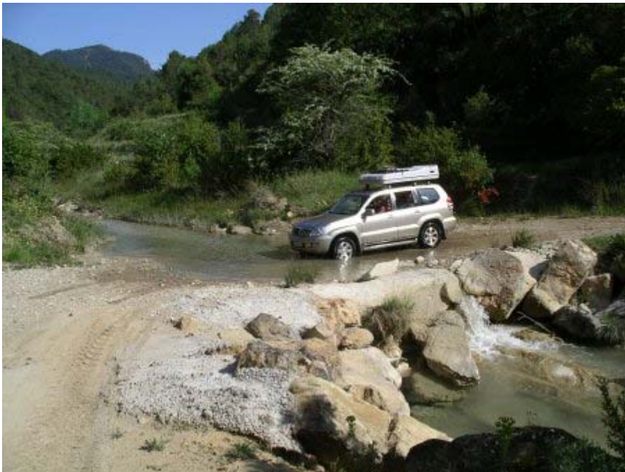
En route vers les Bardenas : un air de déjà vu !