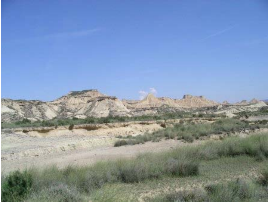
Le secteur de la Pisquera (piste vers le Polygone)