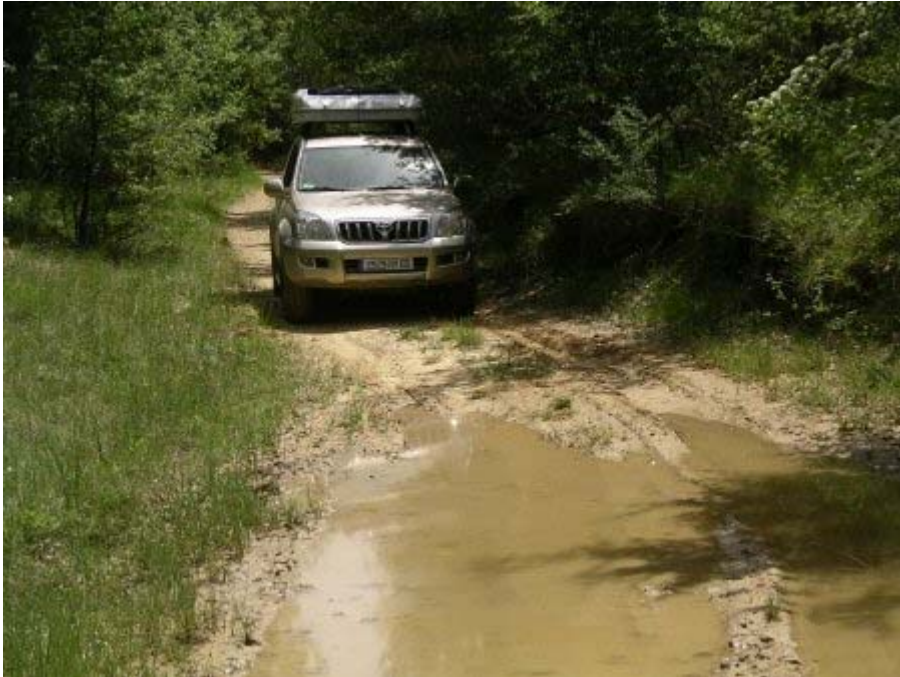
Humidité en sous-bois

.....si ce n'est que tout au long des 4h30 de cette première partie du circuit nous n'avons croisé qu'une seule route bitumée !