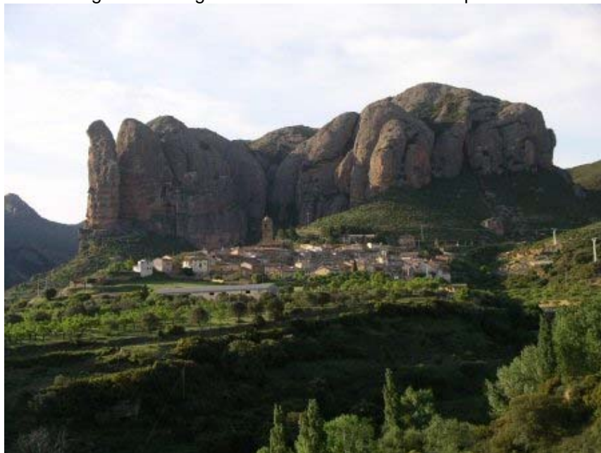
Le village d'Aguëro dominé par ses mallos

Nous passons encore une fois au pied des Mallos de Riglos, pour rejoindre le merveilleux camping d'Aguëro, niché au pied d'un autre groupe de mallos. Ont dit même à Aguëro que les mallos d'ici sont plus beau que ceux de Riglos. Le village en tous cas a un cachet exceptionnel.