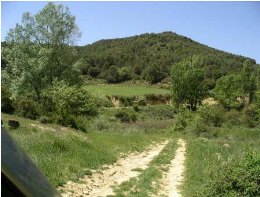
Rare : piste sans ornières ni coupure humide.....

Petite moyenne mais grand plaisir que ce soit dans les passages en crête ou dans les pistes étroites des sous bois