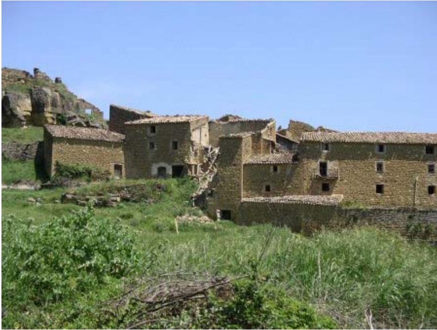
Junez : village abandonné (?) de la Sierra de Luna