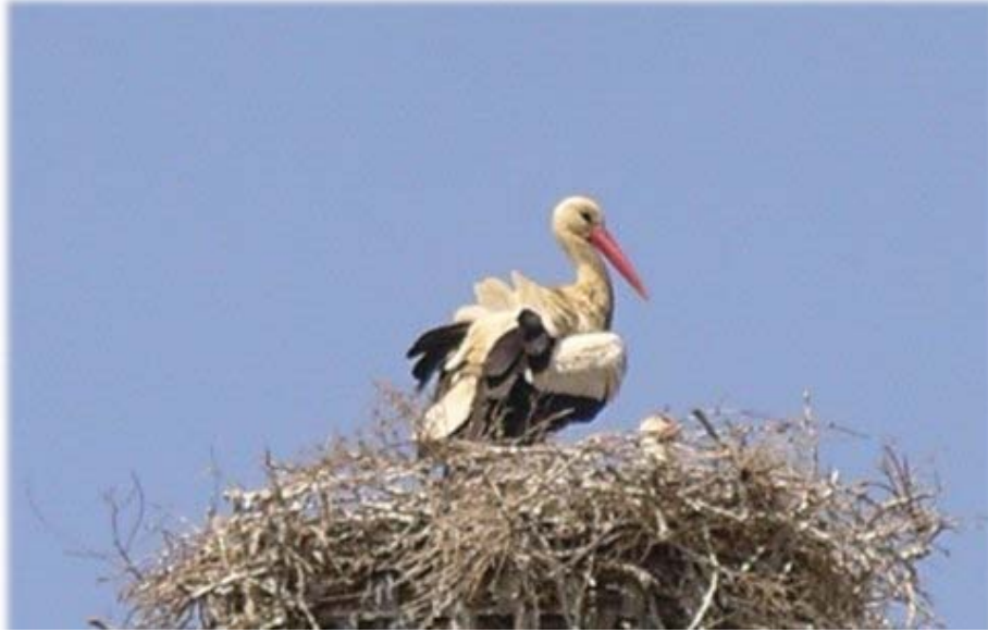
du clocher de l'église au sommets des pylônes , les cigognes....