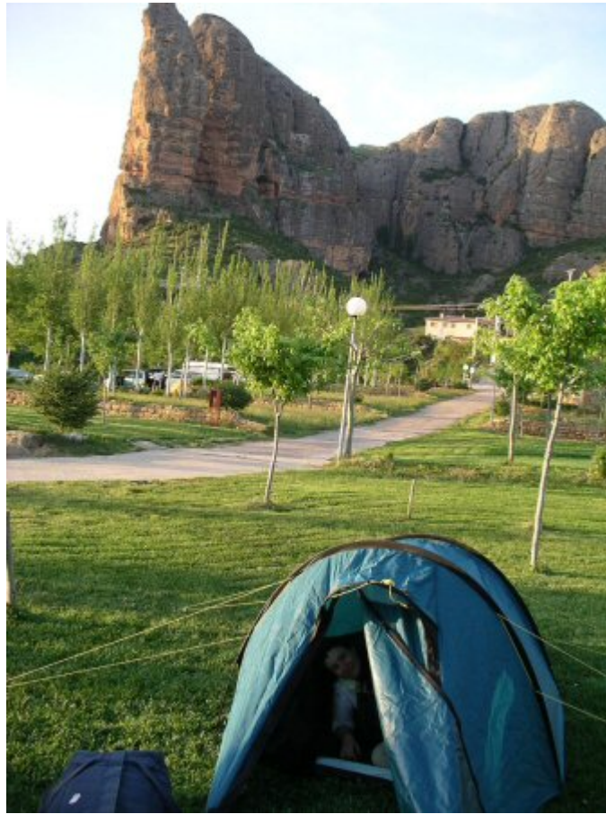
Camping d'Aguëro au pied des mallos

Si pour Paques nous étions seuls avec un vent à décorner tous les taureaux Andalousie, cette fois ci le vent est absent, l'air est très doux et nous devons "partager" le camping avec une dizaine de voiture de la région toulousaine. Mais il y a largement de la place pour tout le monde.