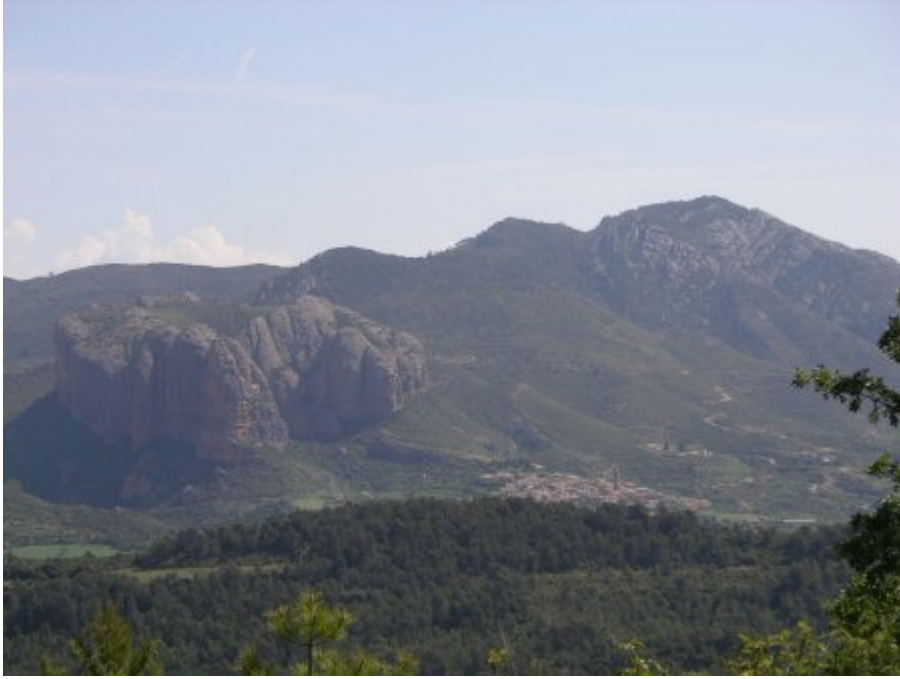
Une vue d'ensemble d'Aguëro au pied des mallos

.....Nous continuerons notre voyage demain.