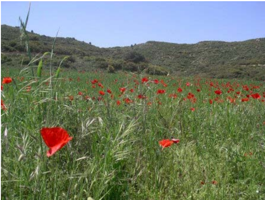
un champ de blé garanti sans OGM : bientôt la fin de la piste