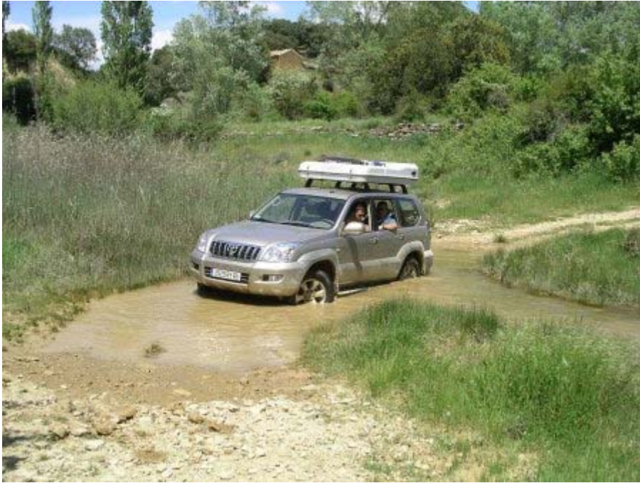
un gué de plus

Petite moyenne mais grand plaisir que ce soit dans les passages en crête ou dans les pistes étroites des sous bois