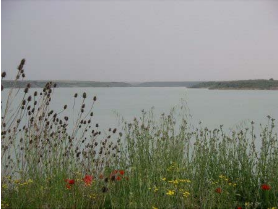
l'embalse d'el Ferial : où est le désert ?

Après la visite de l'ermitage, nous rejoignons Aguilares et le camp militaire que nous allons contourner par le Sud. GPS et carte en main, nous constatons que nous avons les bons repères mais toutes les pistes sont interdites aux véhicules à moteur. Il semblait bien qu'il en existait au moins une permettant de joindre les Bardenas Blanca (au nord) et les Bardenas Negra (centre-sud). Elle existe mais est interdite aux motorisés et même aux VTT. La traversée Nord-Sud ne peut se faire qu'à pied.